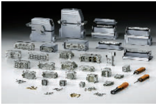
Les connecteurs Rockstar de Weidmüller.

Dès que les physiciens eurent connaissance de l'électricité non plus statique mais celle de la pile de Volta, le connecteur, aussi primitif qu'il fut, apparut ! Il a fallu connecter des câbles, des fils et faire circuler dans ces connexions aussi