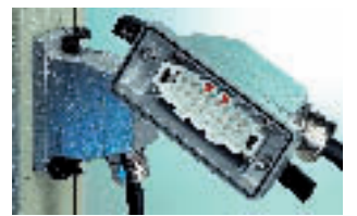
Gamme HC des connecteurs de Phoenix.

certes le meilleur revêtement, mais les techniques des contacts et des couches inférieures de placage permettent d'utiliser une épaisseur d'or pouvant être inférieure au micromètre, avec un nombre d'accouplement très important.